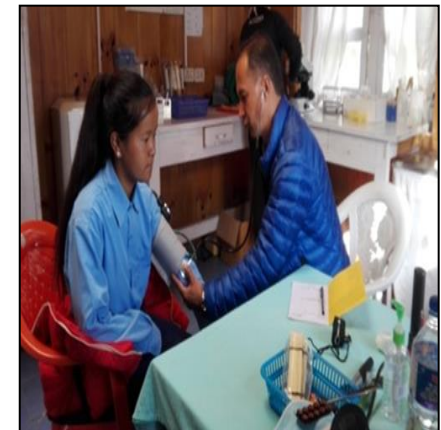
संस्थाद्वारा संचालित निःशुल्क स्वास्थ्य शिविरमा सेवाग्राहीहरुले उपचार गराउँदै