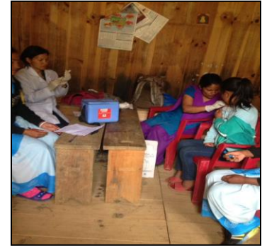
खोपको कार्यक्रम संचालन गर्दै