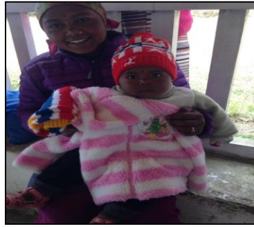
सानो बच्चालाई लुगा प्रदान गरेको फोटो