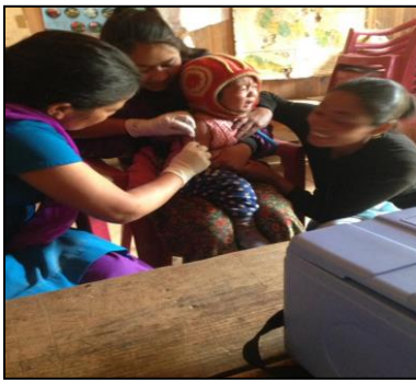
खोप लगाउने क्रममा