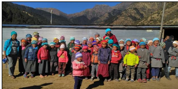
स्वास्थ्य शिक्षा प्रदान गर्ने कममा विद्यार्थीसंग सामुहिक तसविर