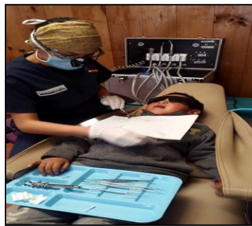
निःशुल्क दन्त शिविरमा दाँतको उपचार गरेको फोटो