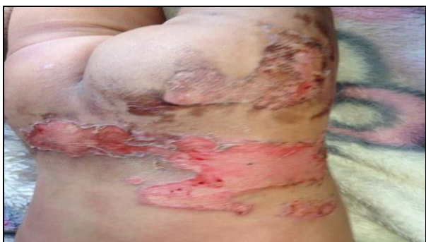
तातो पानीले पोलेको बच्चाको उपचार गरेको फोटो