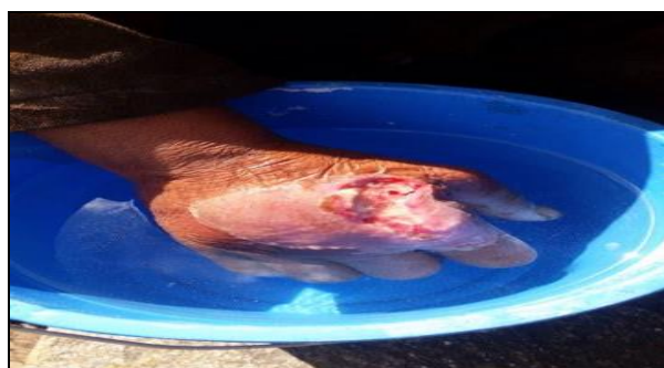
स्वास्थ्य सेवा केन्द्रमा घाँउको उपचार गर्दै