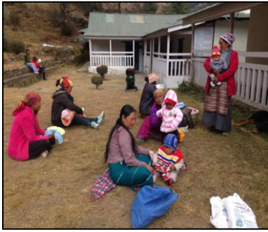
सानो सानो बालबालिकालाई लुगा वितरण

कुसुदेवु जनस्वास्थ्य अभियान नेपालले सञ्चालन गरेका कार्यक्रमहरुको फोटोहरु :