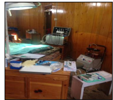
निःशुल्क दन्त शिविरमा प्रयोग हुने उपकरणहरु