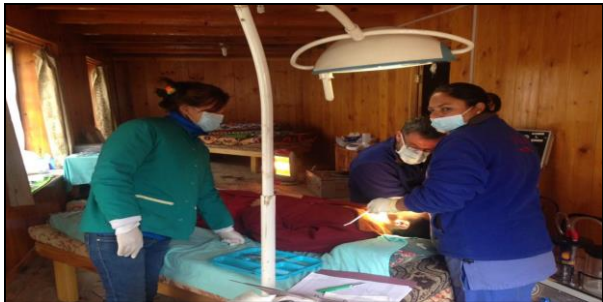
निःशुल्क दन्त शिविर प्रदान गर्ने कममा