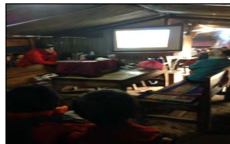
प्रोजेक्टरबाट स्वास्थ्य शिक्षा समबन्धी भिडियो देखाउँदै