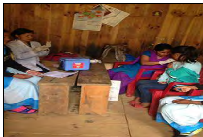
खोपको कार्यक्रम संचालन गर्दै

कुसुदेवु जनस्वास्थ्य अभियान नेपालले सञ्चालन गरेका कार्यक्रमहरुको फोटोहरु :