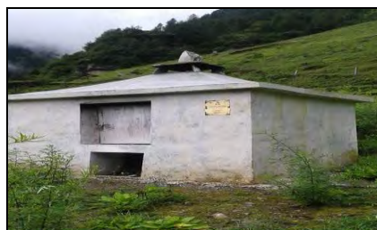
वगैँचइन्सिनेटरको निर्माण गरेको फोटो