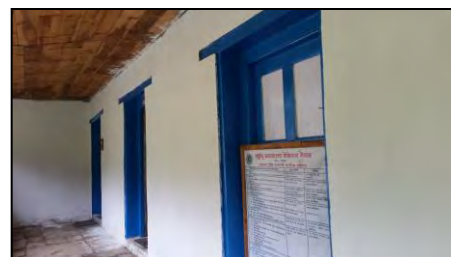
भूकम्प पछि स्वास्थ्य चौकीको मर्मत सम्भार गरेको फोटो