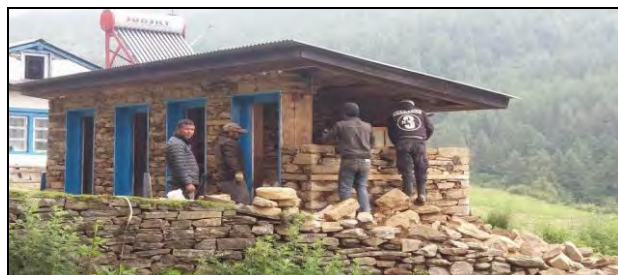
स्वास्थ्य चौकीको चर्पीको पुन निर्माण गर्दै