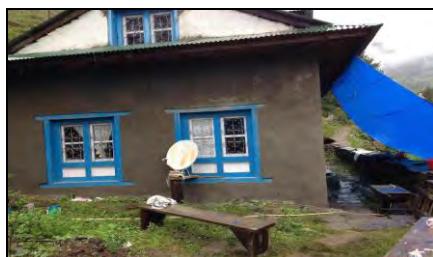
स्टाफ क्वार्टरको प्लास्टरको काम गर्दै