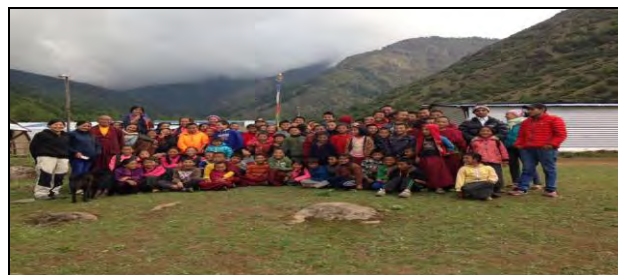
फुङ्गुचे निम्न मा. विद्यालयमा स्वास्थ्य शिक्षा प्रदान गर्ने क्रममा विधार्थीसंग सामूहिक तसविर