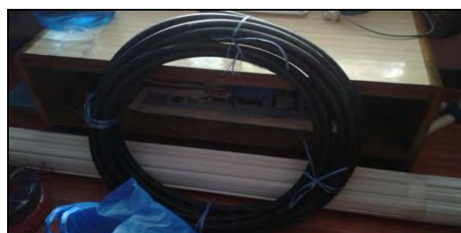
स्वास्थ्य चौकीमा वारिङ्ग गर्ने सामानहरु