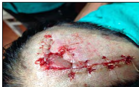
स्वास्थ्य चौकीमा विरामीको घाउको उपचार गर्दै