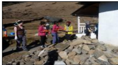
निर्माणको काममा श्रम दान गर्दै