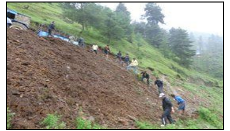
स्थानीय वासीले जस्ता लग्नको लागि वाटो बनाउदै