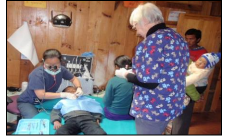
निःशुल्क दन्त शिविरमा विरामीले उपचार गराउदै