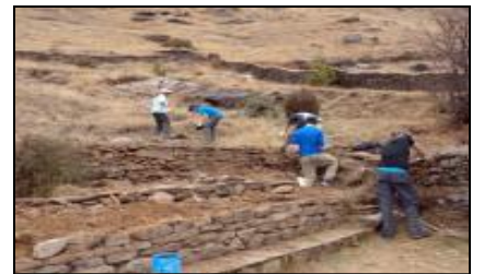
वगैँचा निर्माण गर्दै