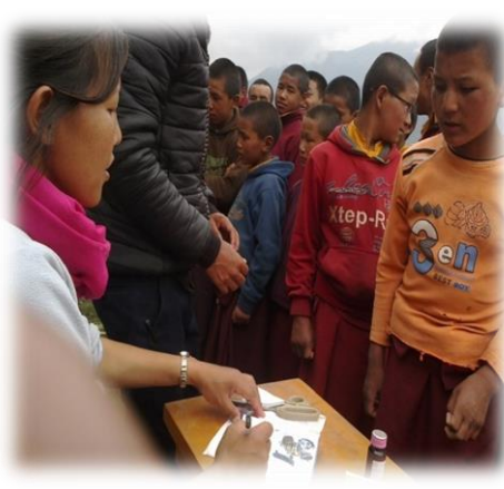
विद्यार्थीहरुलाई उपचार गर्दै