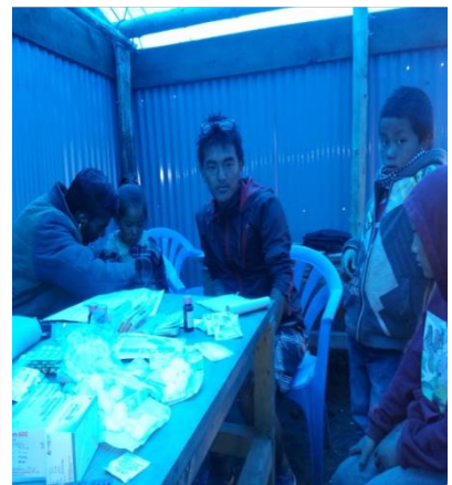
भूकम्प पछि निःशुल्क स्वास्थ्य शिविर संचालन गर्दै