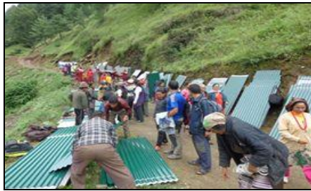
भूकम्प पीडितलाई जस्ता पाता वितरण गरेको