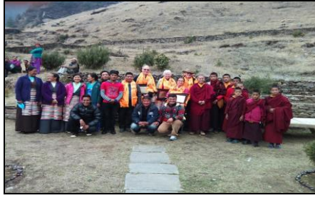
निःशुल्क दन्त शिविरमा सहयोग पुऱ्याएको चिकित्सकलाई समान गरिएको थियो