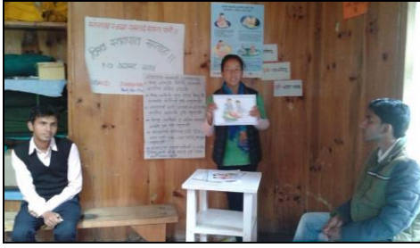
विश्व स्तनपान दिवसको अवसरमा गरेको कार्यक्रम

कुसुदेवु जनस्वास्थ्य अभियान नेपालले सञ्चालन गरेका कार्यक्रमहरुको फोटोहरु :