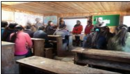
स्वास्थ्य शिक्षा प्रदान गर्दै