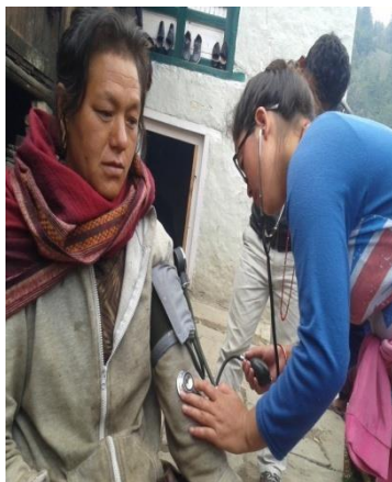
विरामीको घरमा गएर उपचार गर्दै